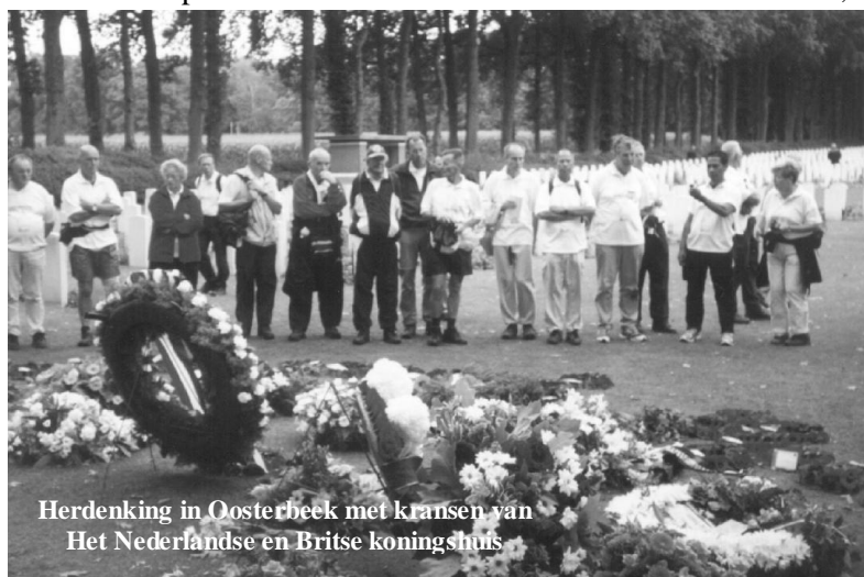
Herdenking in Oosterbeek met kransen van Het Nederlandse en Britse koningshuis

door koningin Wilhelmina onthulde herdenkingsnaald. Velen zullen dit monument kennen, omdat je er tijdens de Airbornetocht ook langs loopt. Langs de buitenwijken van Oosterbeek wandelden we naar de Airborne begraafplaats. De begraafplaats lag vol bloemen en kransen vanwege de herdenking, die hier zondag had plaatsgevonden. Ook wij legden er een bloemstuk. Op de begraafplaats waren ook nu nog veel belangstellenden. Evenwijdig aan de spoorlijn wandelden we verder langs de schitterende zuid-Veluwezoom. Het duurde niet lang voor we de buitenwijken van Arnhem inliepen. Ook in deze buurt stond weer een monument, dat herinnert aan de strijd in september 1944. In het