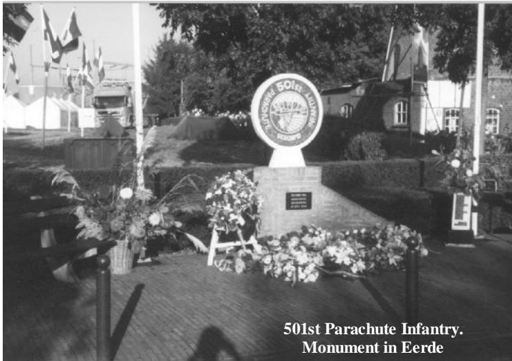
501st Parachute Infantry. Monument in Eerde

De eerste drie dagen waren warm en zonnig; de laatste twee ongeveer 10° C kouder met een harde wind, maar gelukkig niet veel regen. Op de ene avond een diner in een restaurant, de volgende avond op een kampeerboerderij met plastic bordjes en dito bestek. Wat niet veranderde was iedere morgen om 06.00 uur opstaan.