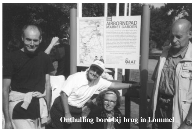
Onthulling bord bij brug in Lommel

Om 13.30 uur beginnen we eindelijk aan onze eerste stappen op deze historische wandeling.