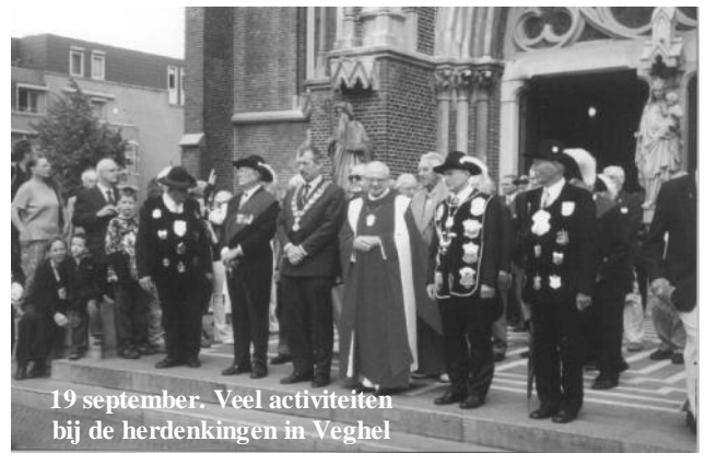
19 september. Veel activiteiten bij de herdenkingen in Veghel

Er is veel publiek in het centrum van Eindhoven.