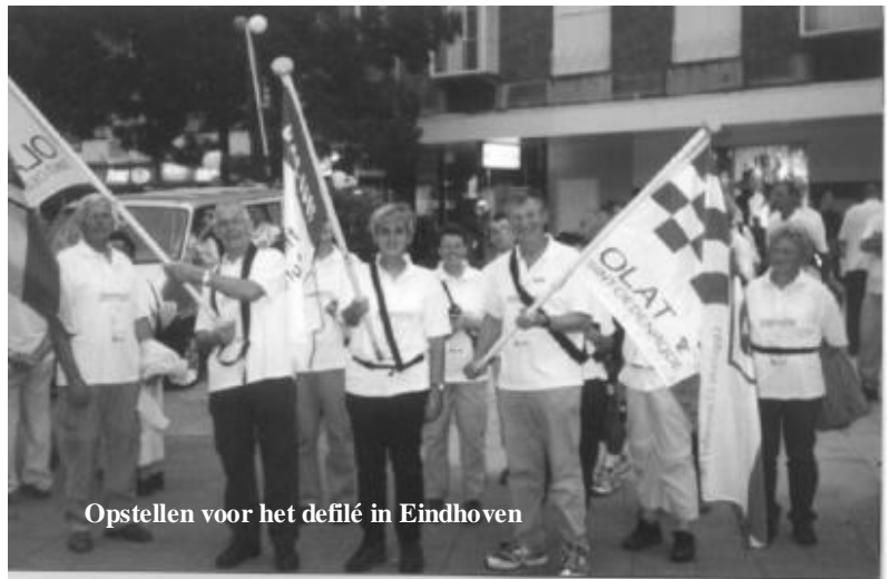
Opstellen voor het defilé in Eindhoven

van Amerika, Engeland, Frankrijk en Nederland. Tijdens het zingen van het door Vera Lynn beroemd geworden lied 'We 'll meet again', zijn we haastig naar de bus gegaan, omdat die om 22.10 uur met of zonder ons zou vertrekken. Tegen elf uur waren we op ons overnachtingadres. We hebben nog een uurtje over de dag nagepraat en zijn toen naar bed gegaan. We hadden een lange enerverende dag achter ons liggen.